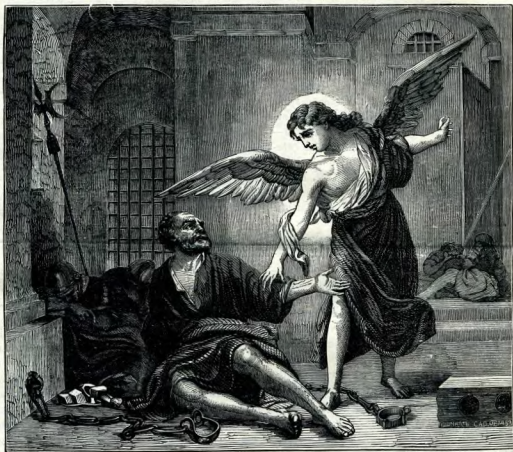
Вериги Апостола Петра.

Цѣпи Ап. Петра сохранились изъ рода въ родъ въ благочестивыхъ семействахъ. При патриархѣ же Ювеналіѣ они перешли въ іерусалимскую церковь, а во время путешествія во Іерусалимъ царицы Евдокіи, супруги Теодосія младшаго, переданы ей. Одну цѣпь она поло-